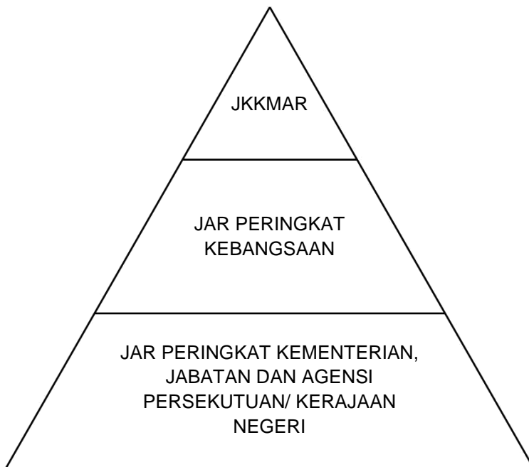
Rajah 1: Hubung Kait Peranan JKKMAR, JAR Peringkat Kebangsaan dan JAR Peringkat Kementerian, Jabatan dan Agensi Persekutuan/ Kerajaan Negeri